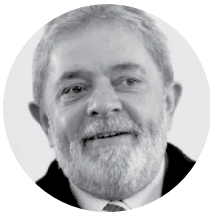
Luiz Inácio “Lula” da Silva

Sede del Insitituto Lula, Sao Paulo, Brassil 4 de mayo de 2016