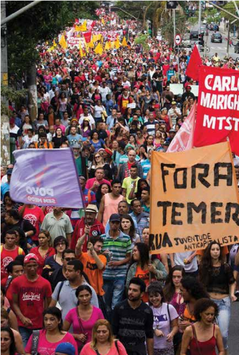
Las manifestaciones y pintas callejeras contra el Gobierno de Michel Temer lograron revertir algunas de sus decisiones iniciales.