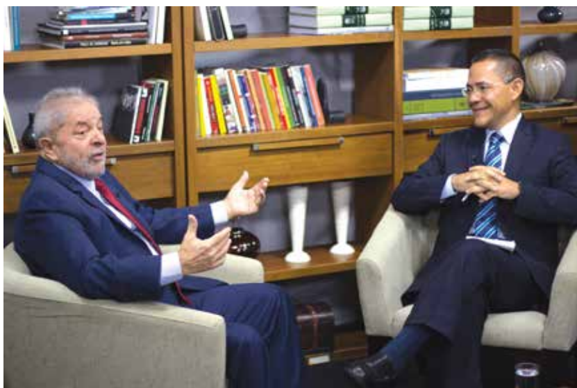
O ex-Presidente Lula da Silva recebeu ao autor na sede do Instituto Lula na cidade de São Paulo.