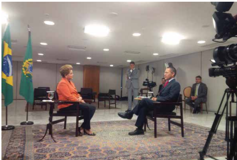
A presidenta Dilma Rousseff recebeu ao autor deste livro e respondeu suas perguntas no Palácio do Planalto.