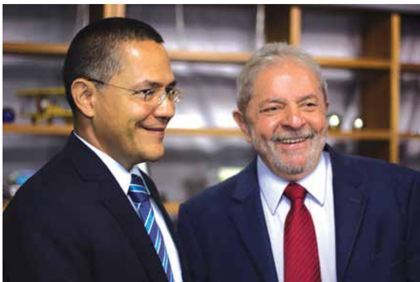
El ex presidente Lula Da Silva recibió al autor en la sede del Instituto Lula en la ciudad de Sao Paulo.