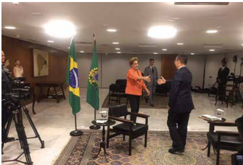
La presidenta Dilma Rousseff recibió al autor de este libro y respondió sus preguntas en el Palacio de Planalto.