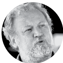
Joao Pedro Stédile

El líder del Movimiento de Trabajadores sin Tierra (MST) defiende la inocencia de la presidenta Dilma Rousseff sin renunciar a sus críticas hacia ella y Lula por las políticas de conciliación de clases durante sus gobiernos. Denuncia a la red O' Globo como el principal enemigo de la clase trabajadora.